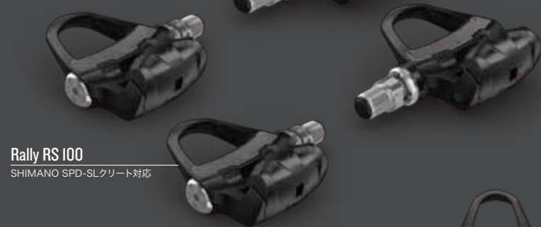
Rally RS 100 SHIMANO SPD-SLクリート対応