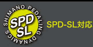
Rally RS 200 SHIMANO SPD-SLクリート対応